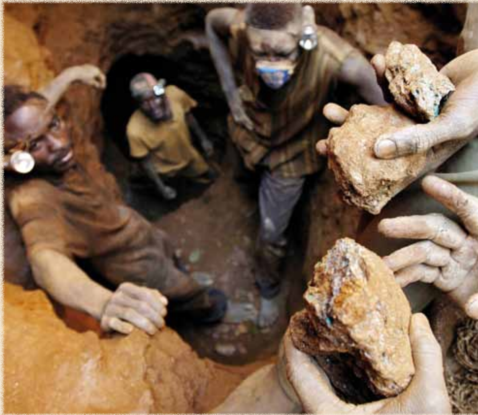
Small-scale copper mining in Africa.